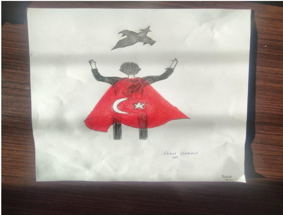
İKBAL BARAN 6A