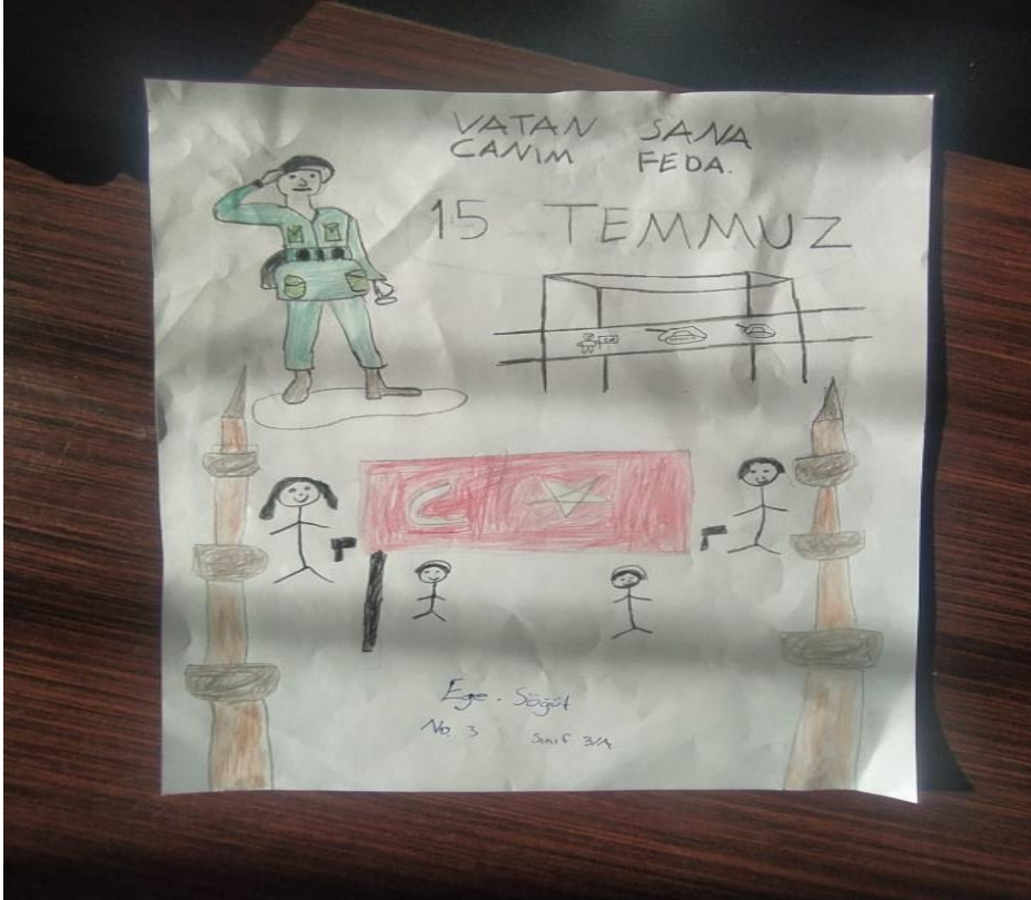
EGE SÖĞÜT 3A