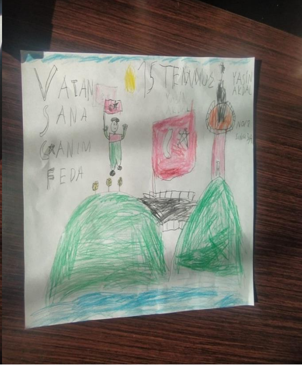
YASİN AKDAL 3A